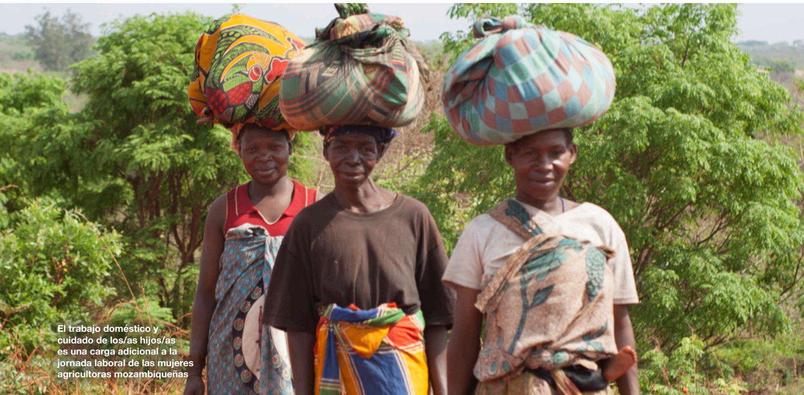
El trabajo doméstico y cuidado de los/as hijos/as es una carga adicional a la jornada laboral de las mujeres agricultoras mozambiqueñas

económicos de manera equitativa y sostenible, y contribuir así a disminuir las grandes diferencias de nivel de bienestar entre la población urbana y rural.