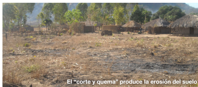
El “corte y quema” produce la erosión del suelo

El sistema agrícola más común en la zona norte de Mozambique se basaba en la técnica muy antigua de “corte y quema” , es decir, consiste en cortar árboles y quemar la vegetación baja de una parte de bosque para aprovechar ese suelo rico en materia orgánica y minerales como parcela de cultivo. Después, tras unos años, abandonan esa parcela y la dejan sin cultivar (barbecho) durante unos 40 años, y se trasladan a otra parcela sin utilizar. Además de ser un método que genera bajos rendimientos productivos, requiere disponer de muchas tierras y es ecológicamente insostenible .