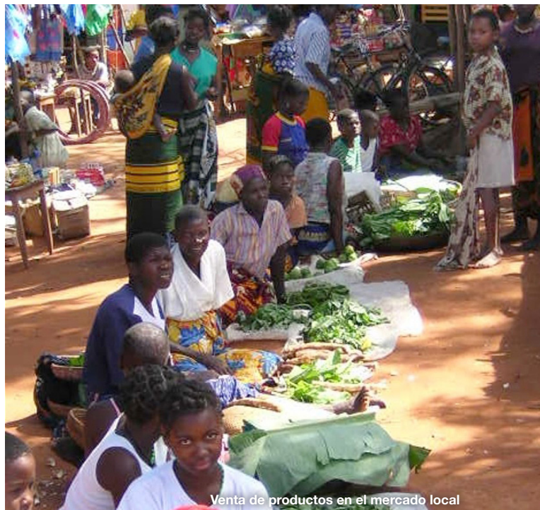
Venta de productos en el mercado local

Dados los bajos niveles de producción agrícola, se podía considerar una agricultura de subsistencia destinada prácticamente en su totalidad al consumo de la familia. El pequeño excedente que conseguían algunas familias lo vendían en la propia aldea o aldeas cercanas. La escasa producción no les permitía plantearse la venta de los productos en las capitales del distrito, donde podrían conseguir un mejor precio. La producción no alcanzaba para que la población campesina pudiera obtener unos medios de vida mínimamente suficientes.