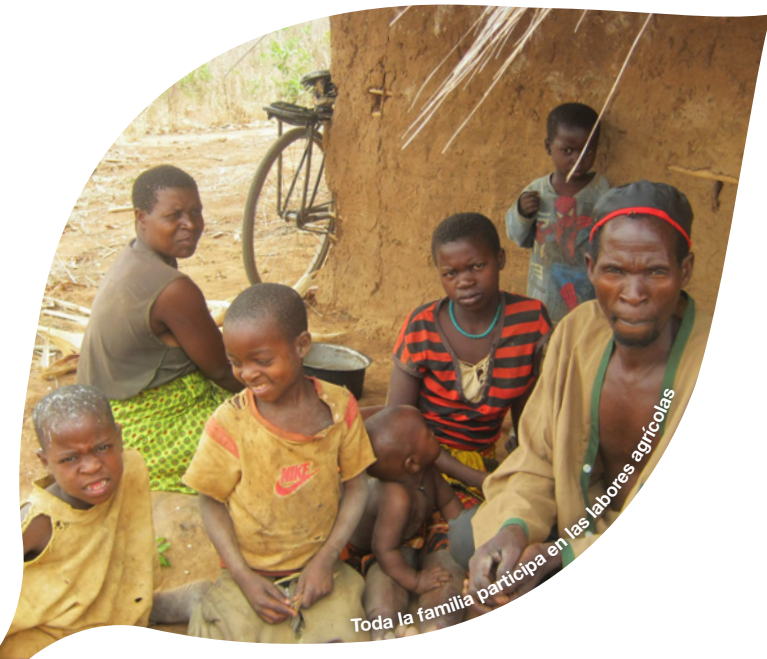
Toda la familia participa en las labores agrícolas

Conviene tener en cuenta que en Mozambique el 85 % de la población se dedica a una agricultura de tipo familiar, con baja productividad que apenas genera excedentes que puedan vender en el mercado . La falta de recursos económicos condiciona el día a día de la población, ya que les impide adquirir alimentos básicos, asumir el coste del transporte para ir al hospital, hacer reparaciones en la casa o pagar el teléfono. Estas condiciones agudizan las desigualdades entre la población rural y la población urbana.