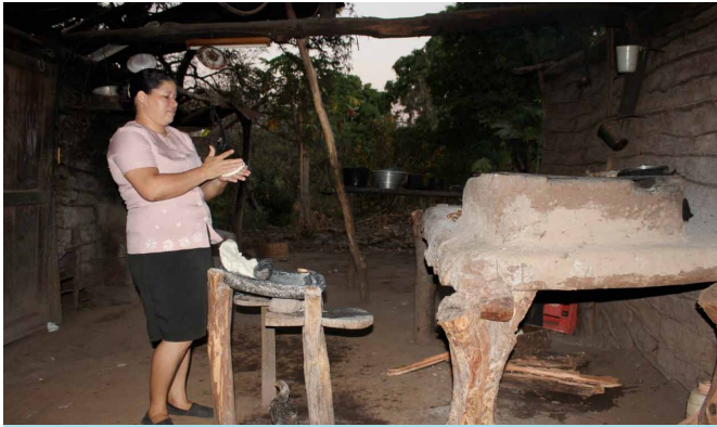
Señora preparando la comida en su vivienda

El servicio de salud en esta comunidad consiste básicamente en la visita semanal de un promotor o promotora de salud, procedente de la Unidad de Salud Familiar ubicada en la capital del municipio, que se desplaza al pequeño centro de atención sanitaria que existe en la comunidad. En su ausencia, las personas de San José Guadalupe deben caminar más de una hora hasta llegar a un establecimiento de la red de salud que cuente con personal sanitario cualificado.