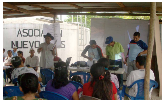
Reunión de la ADESCO