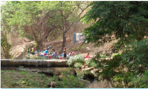
El aseo y el lavado de ropa en el río es una práctica habitual

alta de la montaña, y así poder abastecer al centro escolar y a un sector de viviendas de la comunidad. Lamentablemente, esta infraestructura ha presentado notables deficiencias técnicas de diseño y de utilización de materiales inadecuados. Cada cierto tiempo se producen sobrepresiones que rompen la tubería, y además, el reparto es desigual ya que las viviendas de la zona alta reciben más agua que las de la zona baja, lo cual genera conflictos. Éste es una muestra de la carencia de capacidades suficientes, a nivel técnico y a nivel de gestión y planificación económica, del gobierno municipal de Comasagua para llevar a cabo actuaciones que resuelvan los problemas de abastecimiento de agua y provisión de servicio de saneamiento para la comunidad.