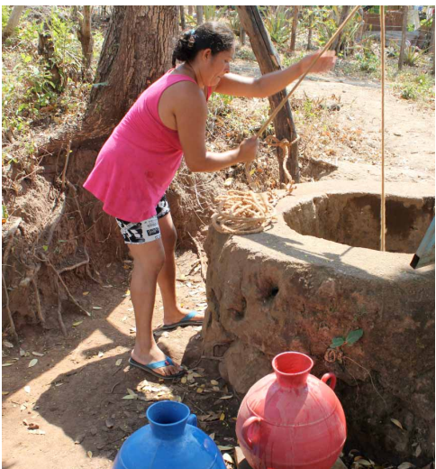
Mujer sacando agua de un pozo

Otro problema en relación al agua que sufre la población de esta comunidad de forma generalizada es la contaminación del agua . La defecación al aire libre, el lavado de ropa en el cauce del río, el abandono de basuras y el uso de agroquímicos provocan la contaminación de aguas superficiales y subterráneas por filtración de los lixiviados, lo cual constituye un riesgo sanitario y que afecta a las personas y también a la fauna y flora del entorno. Recientes estudios del Ministerio de Medio Ambiente y Recursos Naturales de El Salvador han revelado que el 38% de los ríos del país tienen agua de calidad mala o pésima, y el 50% de calidad regular. El consumo de agua insalubre, la suciedad, los malos olores y la presencia de insectos son factores que hacen a la población más vulnerable a padecer enfermedades. La diarrea y la gastroenteritis son las enfermedades más comunes que afectan fundamentalmente a los niños y las niñas menores de 5 años, y que en esta zona rural sin atención médica adecuada pueden ser causa de muerte.