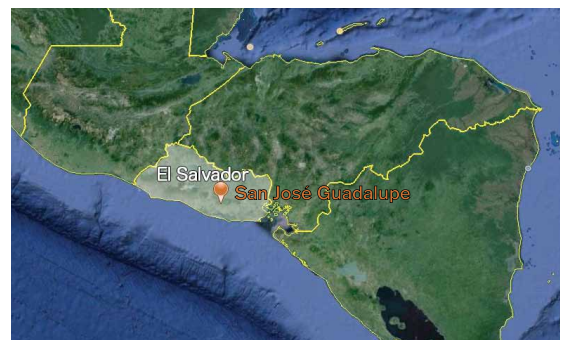
San José Guadalupe se encuentra en la zona central montañosa de El Salvador

El 55% de las viviendas cuenta con energía eléctrica, bien sea de la red de suministro o bien por medio de paneles solares. Las viviendas están construidas a base de materiales toscos: las paredes son de cañas o pajas mezcladas con barro y el suelo de la vivienda es simplemente tierra aplanada.