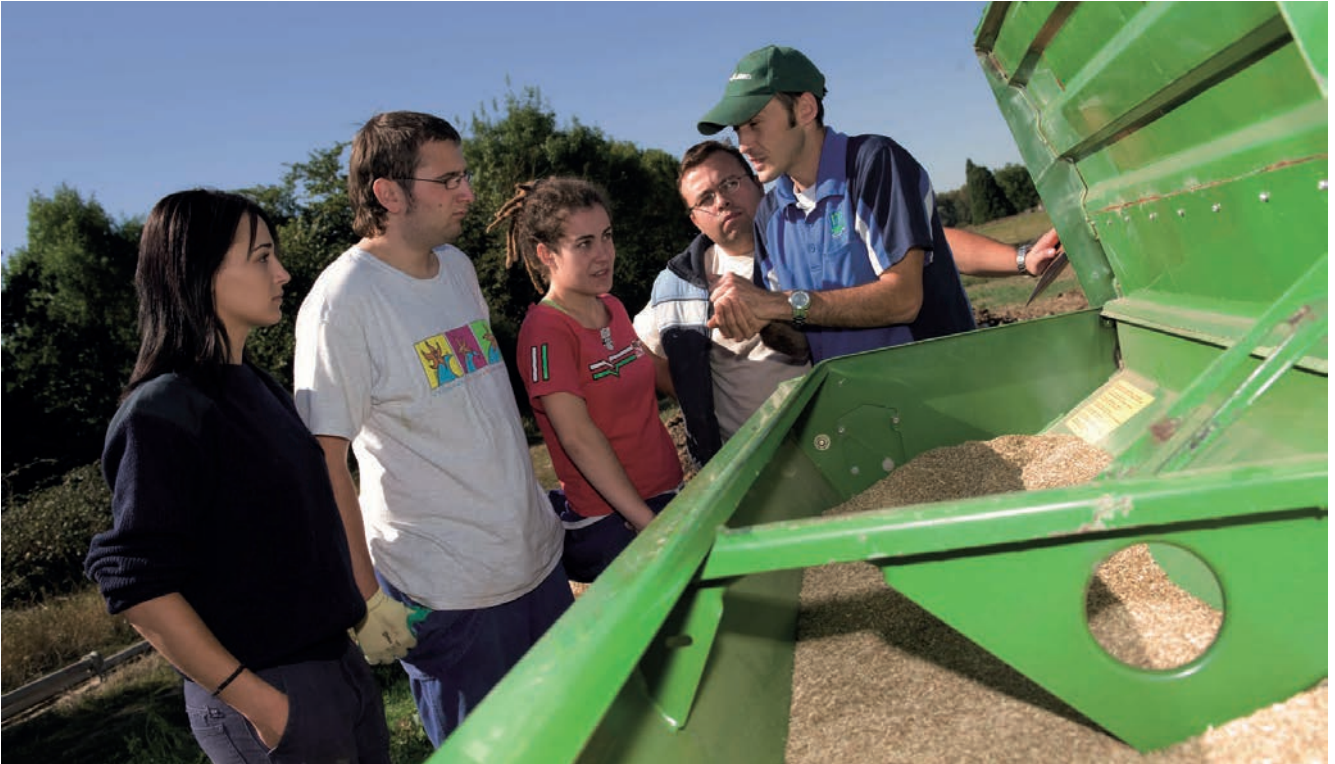
Formación en Producción Agroecológica (Itsasmendikoi)

profesionales del sector primario (agrario y marítimo-pesquero) y empresas alimentarias, asociaciones profesionales y otras entidades, personas que deseen incorporarse al sector y al medio rural con la puesta en marcha de un proyecto empresarial agrario o implantado en el medio rural; y población del medio rural y litoral ; con la finalidad de mejorar su cualificación profesional.