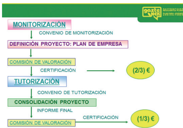
Procedimiento del programa GAZTENEK

Programa de formación y acompañamiento a nuevos/as emprendedores/as que tengan la inquietud por poner en marcha proyectos empresariales de cualquier orientación productiva o de servicios en el medio rural y en zonas pesqueras.