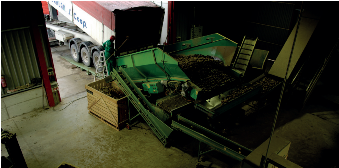
Cooperativa GARLAN

sempleo, hundimiento de las grandes empresas de Bizkaia, inflación, terrorismo, golpismo, aunque a la vez, había mucha ilusión con la llegada de la democracia y la libertad.