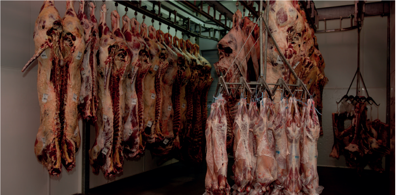
Matadero Urkaiko

AHORROS VASCAS que han financiado suficiente y en buenas condiciones al sector.