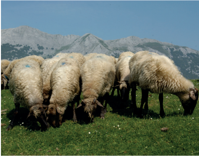
Ovejas latxas en el Parque Natural de Aizkorri-Aratz

Sin embargo, nuevamente fueron apareciendo conflictos según avanzaba la declaración de lugares protegidos. Algunas personas propietarias de terrenos y agentes ligados al sector primario se resistían a acatar normas de conservación al entender que la Viceconsejería de Medio Ambiente invadía competencias de otras administraciones o sectores, a pesar de existir una prevalencia de las políticas de conservación sobre el resto de políticas. La pérdida de derechos y limitaciones al desarrollo de las actividades productivas, a las responsabilidades y competencias de otras administraciones son la causa de muchos de estos conflictos.