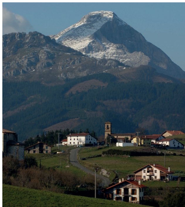
Monte Anboto desde Aramaio, en el Parque Natural de Urkiola

1989 : se declaró, por decreto, el primer espacio protegido de Euskadi, el Parque Natural de Urkiola , bajo la Ley básica del estado de Conservación de los Espacios Naturales y de la Flora y